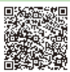
新豐國小 臉書粉絲團